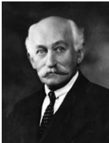
14. kép – Henry Balfour, a Brit Tudományos Akadémia elnöke, Torday egyik támogatója és méltatója

benszülött művészet esztétikai értékének fölbecsülésében nem kell többé a primitív népek mértékét alkalmazni.”