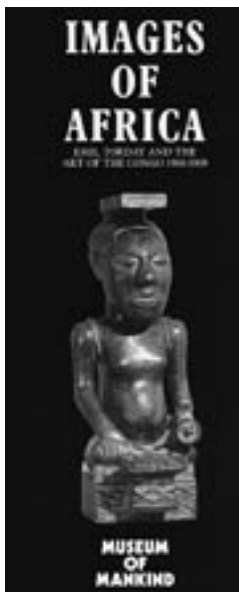
1. kép – A londoni British Museumban szervezett kiállítás prospektusa ( Images of Africa )