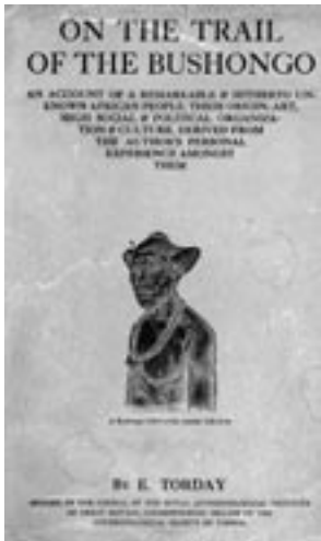
18. kép – Torday egyik legnépszerűbb könyvének címlapja ( On the Trail of the Bushongo )

Csupán a Royal Anthropological Institute archívumában és a British Museumban található felvételek éltek túl a világegést.