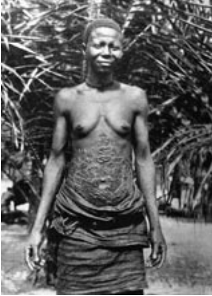
3. kép – Sebforradások egy busongo asszonyon. A késsel vágott rituális sebek mitológikus jelen- téstartalmat hordoznak)