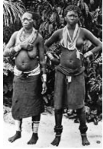
8. kép – Busongo asszony és lánya az isambó altörzsből

Részletesen leírta a bennszülöttek lakóhelyeit, konyhóit, használati tárgyait, táplálékukat, étkezési szokásaikat, a rabszolgatartás különféle változatait és az emberevés a századfordulón még élő hagyományait.