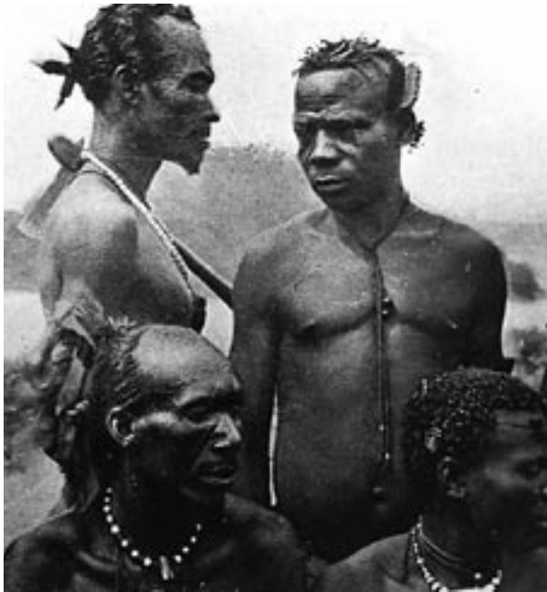
5. kép – A baluba törzs tagjai a Moero-tó partján

Első utazása sem volt eredménytelen, de legnagyobb jelentőségét az adja, hogy szerteágazó hely- és nyelvismeretet szerzett, valamint sokrétű személyes kapcsolatokat alakított ki a gyarmati hatóságok képviselőivel és a helyi törzsek vezetőivel. Elsajátította a földrajzi és néprajzi terepmunka