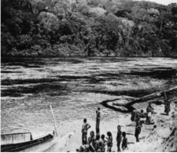
7. kép – A Kasai folyó egyik csónakkikötője