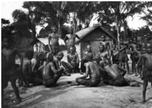
10. kép – Déli bambalák törzsi tanácskozása