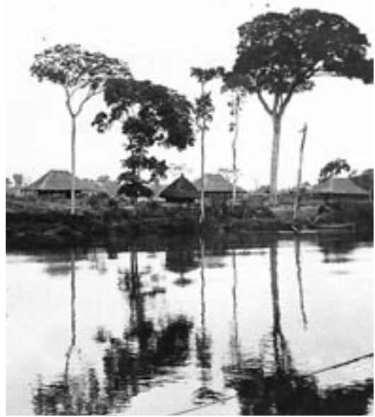
4. kép – Lokombe falu a Kongó-medencében

tagjaként kellett elnyernie a helybéli afrikaiak bizalmát. A belgákkal szemben tartózkodó, gyakran ellenséges magatartást tanúsító kongói törzsek tagjai nagyon nehezen fogadták be a fehérbőrű idegent.