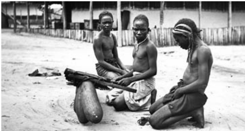
9. kép – Bambala fiúk ütőhangszerrel játszanak

velük együtt temetik el. A villámcsapás áldozatait hanyatt fektetve földelik el. Gyászuk jeléül a férfiak homlokukat, a nők egész arcukat bemázolják feketére.