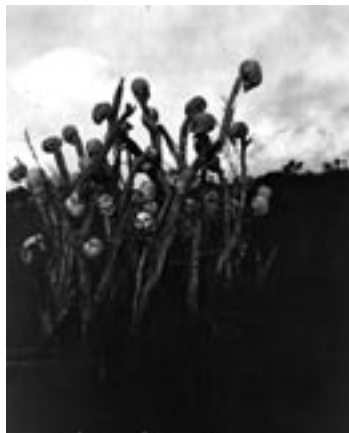
11. kép – Badzsok koponyák, mint háborzongató győzelmi trófeák, faágakra tűzve